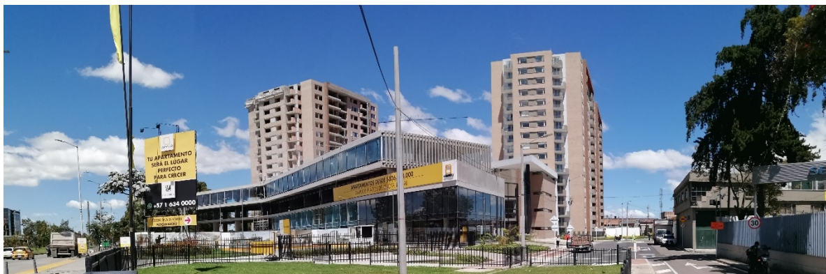
Fotografías No. 1. Cerramiento de obra sin afectaciones al entorno circundante.